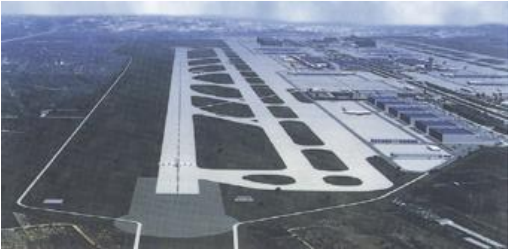
Το νέο αεροδρόμιο των Σπάτων - Ελευθέριος Βενιζέλος