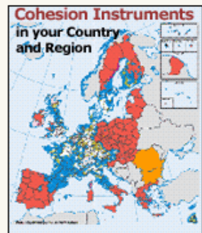
Eligible areas in EU25 for Objective 1 and 2 between 2000 and 2006

For information about eligible regions and financial allocations click on a country below: